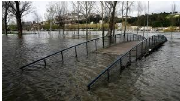
Cheias / Chuvas Torrenciais